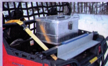
Praktisch: Alubox für Bergegurte