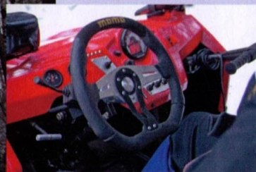
Griffig: Edles Momo-Lenkrad